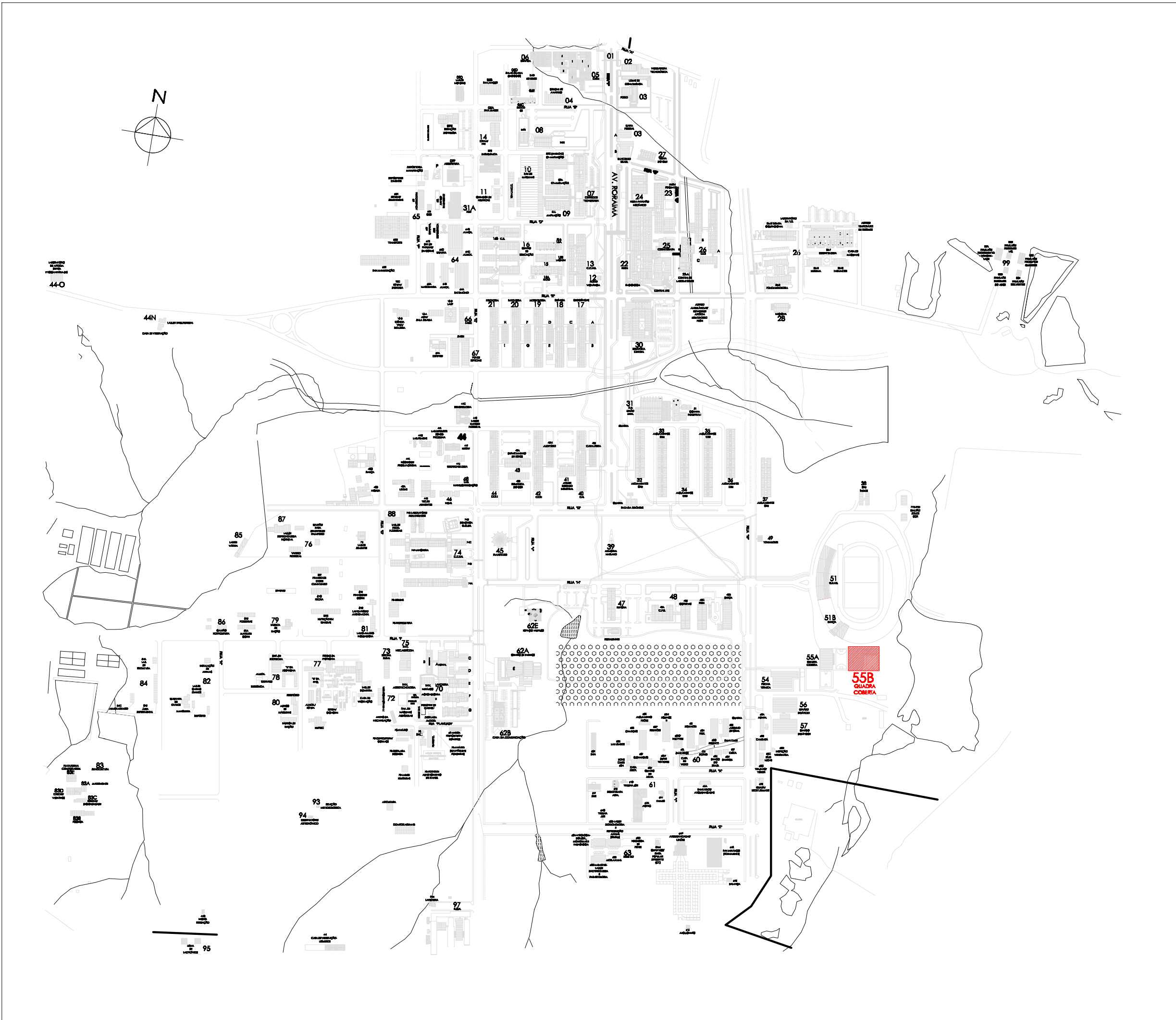
PLANTA DE SITUAÇÃO Esc: 1/7.500